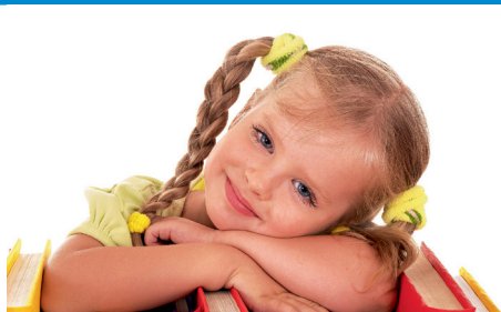
Grundschule Reichenbach Unterrichtsbeginn