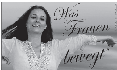
Eine Initiative von Frauen für Frauen auf der Grundlage der Bibel.