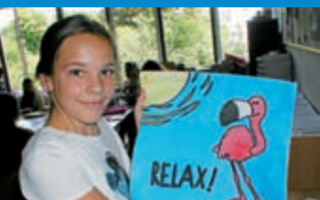
Schlossschule - Gelungenes Schulfest