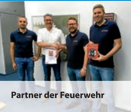
Partner der Feuerwehr