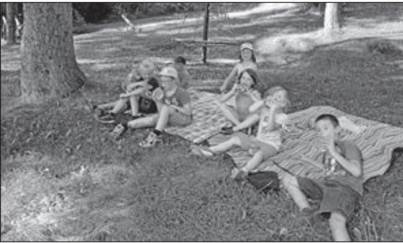
Kinderferienprogramm des Musikvereins

Wehingen statt. Am Haller Areal trafen sich 15 Kinder, um gemeinsam an den Waldspielplatz zu wandern. Dort angekommen wurde zuerst einmal der Spielplatz unter Beschlag genommen. Anschließend durfte jeder seine Wurst am Feuer grillen. Am Abend wurden die Kinder wieder abgeholt und ein erlebnisreicher und schöner Spielenachmittag ging zu Ende.