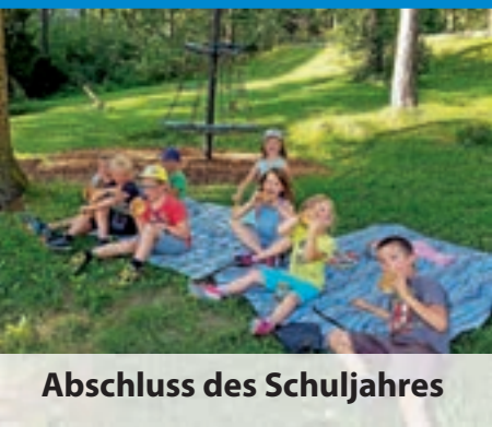
Abschluss des Schuljahres