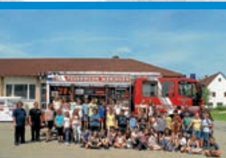
Grundschüler besuchen FFW