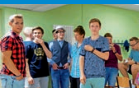
Hochsulticket in der Hand