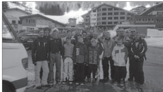
Foto der Teilnehmer