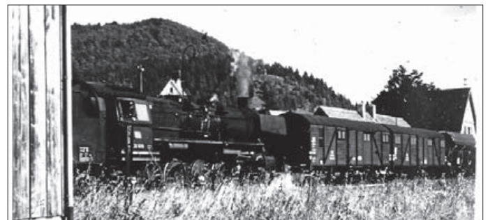
Lokomotive vor dem Bahnhofsgebäude in Reichenbach

Die Heubergbahn nimmt langsam Fahrt auf. Dafür möchten wir uns bei Euch herzlich bedanken. Nach und nach kamen immer wieder Zeitungsberichte, Bilder und Beschreibungen über die Heubergbahn bei uns an. Bitte stöbert weiter in Euren Fotoalben oder auf dem Dachboden nach Schätzen aus dieser Zeit. Um nur einige Dinge zu erwähnen, möchten wir an die Originalglocke der Güter-Lokomotive, die Original-Bahnhofsuhr aus dem Amtszimmer und ein Streckenzeichen von der ursprünglichen Schienentrasse der Heubergbahn erinnern. Heubergbahnführer oder Sonder-Fest-Nummer des „Heuberger Bote“ zur Eröffnung der Heuberg-Eisenbahn Spaichingen-Reichenbach am Freitag, den 25. Mai 1928 sind ebenso