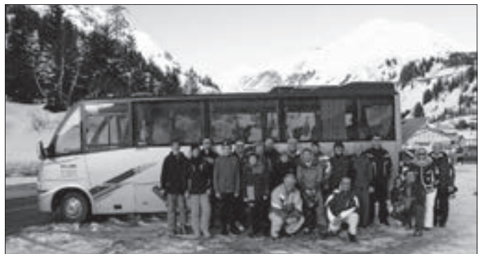
Foto zeigt die Wehinger Skisportler kurz vor der Abfahrt in Stuben.

Als man letzten Samstag so kurz nach 6 Uhr los fuhr, regnete es in Strömen - so waren die Erwartungen der Teilnehmer der Skiausfahrt des Skiclubs eher bescheiden.