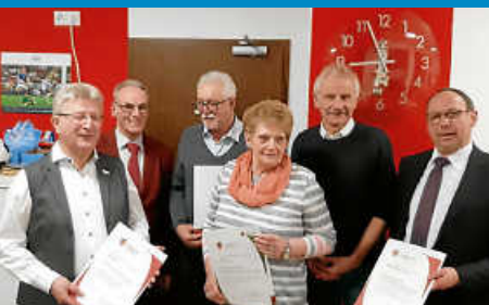
Albverein OG Reichenbach ehrt treue Mitglieder