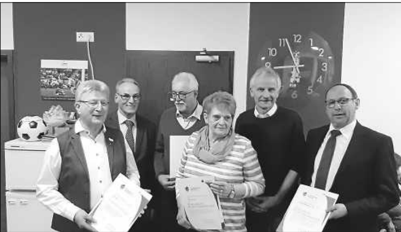
Die Geehrten der Ortsgruppe Reichenbach

Der stellvertretende Gauobmann erwähnte vor den Ehrungen noch, wie großartig unsere Landschaft und unser Freizeitangebot den Tourismus fördern. Dies sei auch eine deutliche Botschaft auf der CMT in Stuttgart gewesen. Er bestätigte der Vereinsführung, eine der am besten geführten Ortsgruppe zu sein. Dies bestätigten auch die eindrucksvollen Bilder vom abgelaufenen Jahr.