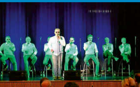
Seelsorgeeinheit lädt zum Mitarbeiterabend ein