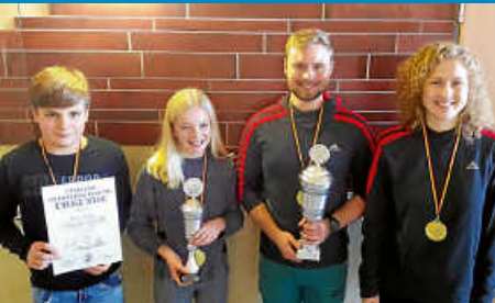
Vereinsmeisterschaften der Schwimmer